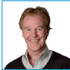
بروفيسور / بيتر سينجي