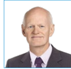
د. مارشال جولدسميث

مؤتمر الإبداع الخليجي الثاني "الإبداع في القيادة" ٦ - ٨ مايو ٢٠١٢