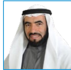
د. طارق السويدان