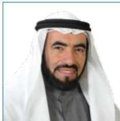
د. طارق السويدان