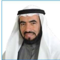
د. طارق السويدان