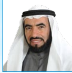
د. طارق السويدان