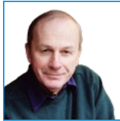
بروفيسور / جون أدير