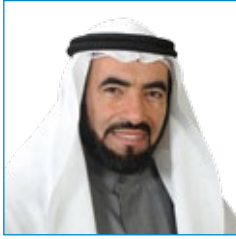
د. طارق السويدان