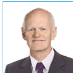
د. مارشال جولدسميث