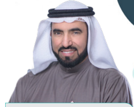
د. طارق السويدان

تقديم مواد تدريبية عملية ليتم تقييم المتدرب بناء عليها فيتعرف على أساليب التقييم ويضع خطة شخصية لتطوره كمدرّب محترف