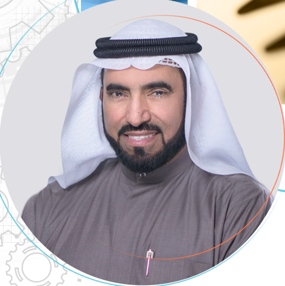
د. طارق السويدان